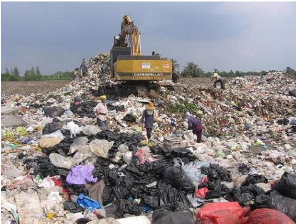
ภาพแสดง ปริมาณถุงพลาสติกที่ก่อให้เกิดมลภาวะต่อระบบนิเวศน์ และความหลากหลายทางชีวภาพ

ทั้งนี้ ปัจจุบัน (กันยายน 2550) กทม.ต้องเก็บขยะมากถึง 85,00 ตัน/วัน เป็นถุงพลาสติกถึงร้อยละ 21 หรือ 1,800 ตัน/วัน ดังนั้น หากเปลี่ยนมาใช้ถุงผ้าแทน จะช่วยลดค่าใช้จ่ายการเก็บขยะได้วันละ 1.78 ล้านบาท/วัน หรือคิดเป็น 650 ล้านบาท/ปี