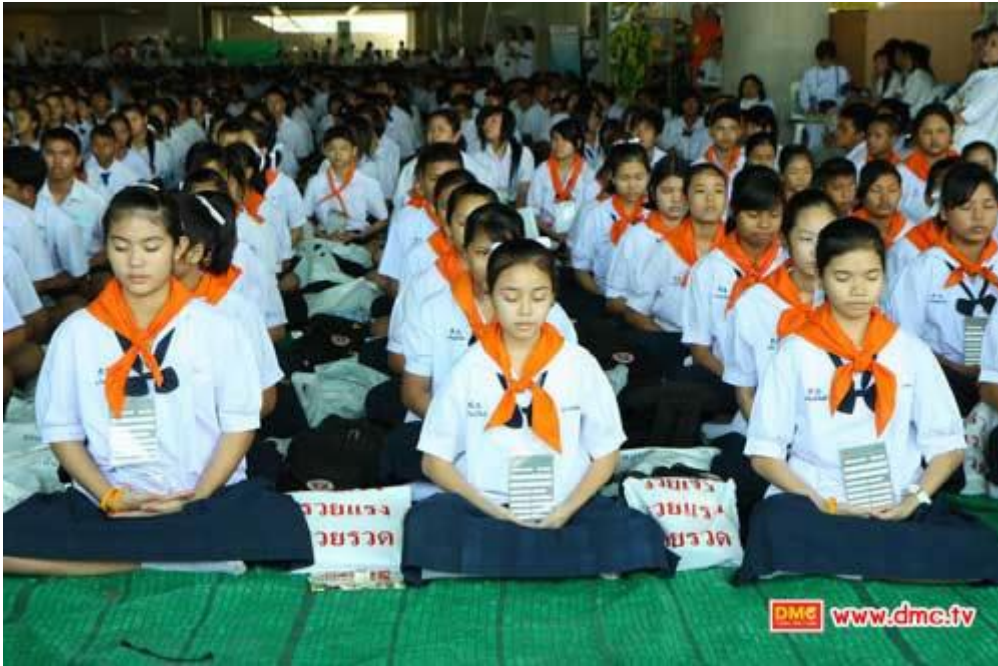
ภาพแสดง การใช้ถุงพลาสติกสำหรับใส่รองเท้าเพื่อรักษาความเป็นระเบียบ เมื่อมีคนมาปฏิบัติธรรมมากขึ้น

เนื่อง จากในปัจจุบันวัดพระธรรมกายมีสาธุชนเข้าวัดปฏิบัติธรรมเพิ่มมากขึ้นทุกปี ไม่ว่าจะเป็นโครงการเด็กดี V-Star โครงการบวชอุบาสิกาแก้วหน่ออ่อน โครงการบวชพระธรรมทายาท เป็นต้น ทำให้ปริมาณการใช้ถุงพลาสติกสำหรับใส่รองเท้าก็ต้องเพิ่มมากขึ้นตามไปด้วย ถึงแม้ว่าการใช้ถุงพลาสติกของทางวัดพระธรรมกายจะมีการนำกลับมาใช้ซ้ำ แต่บางครั้งสาธุชนก็ไม่ได้นำส่งคืนกับเจ้าหน้าที่อาสาสมัครที่ดูแล และถึงแม้จะนำถุงพลาสติกกลับมาใช้ใหม่ได้แต่ก็มีข้อจำกัดของจำนวนครั้ง ในที่สุดก็ต้องชำรุด หรือขาดใช้งานต่อไม่ได้