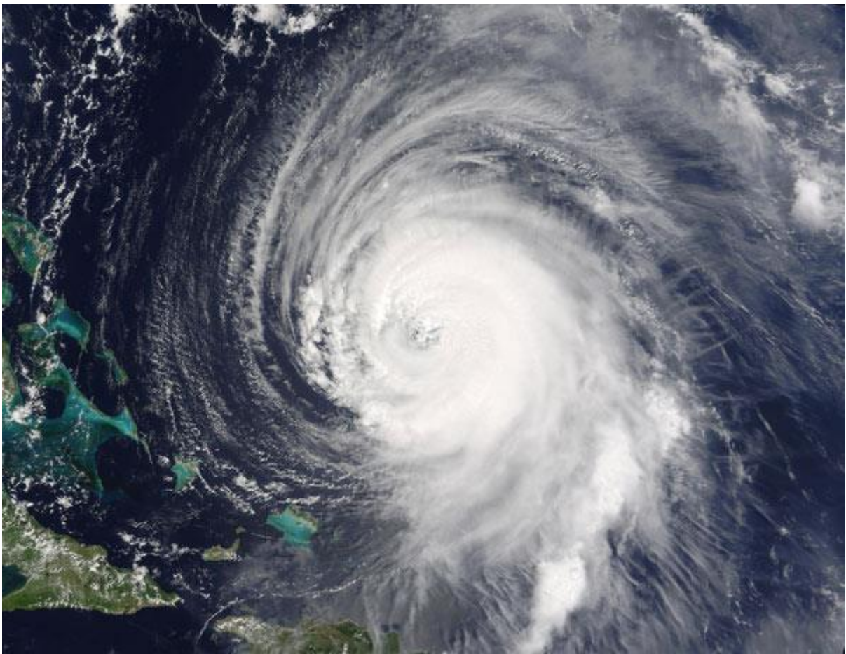
ภาพแสดง ภาพอากาศแปรปรวน เกิดพายุหมุนที่มีความรุนแรง